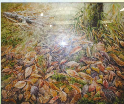
※写真は第14回の入賞作品です。