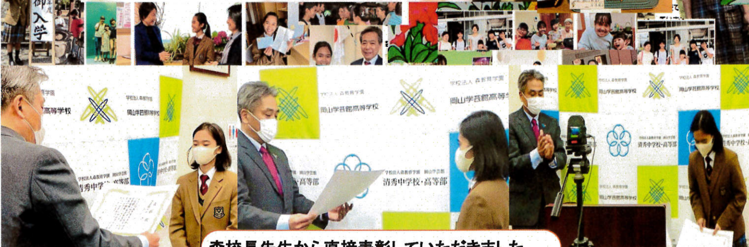
森校長先生から直接表彰していただきました