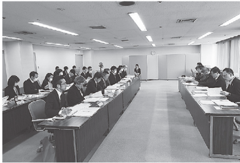
▲活発な意見交換が行われた会議の様子

発行所 一般社団法人・大阪労働者福祉協議会 〒540-0031 中央区北浜東3番14号 電話06(6943)6025 毎月1日発行 1部20円 発行人 黒田悦治 編集協力・機関紙広報研究センター