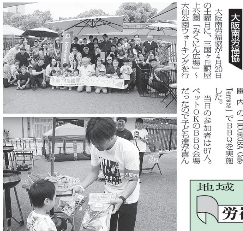
▲仁徳天皇陵を半周したあと、大仙公園内の「ICOROBA Cafe Terrace」でBBQで盛り上がった

大阪府協働が4月20日の土曜日に、三国ヶ丘駅屋上公園「みくに広場」で大仙公園ウォーキングを行った。当日の参加者は67人。ペットOKのBBQ会場だったので子ども達も喜んでいました。