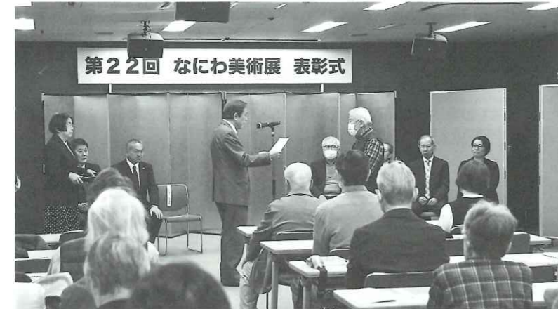
第22回 なにわ美術展 表彰式

発行所 一般社団法人・大阪労働者福祉協議会 〒540-0031 中央区北浜東3番14号 電話06(6943)6025 毎月1日発行 1部20円 発行人 黒田悦治 編集協力・機関紙広報研究センター