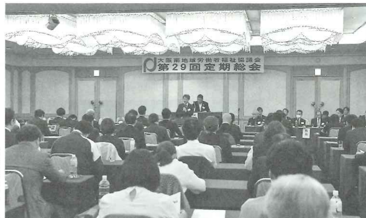
▲独自の異業種交流や各地区の組織強化継続を決めた大阪南労福協の定期総会