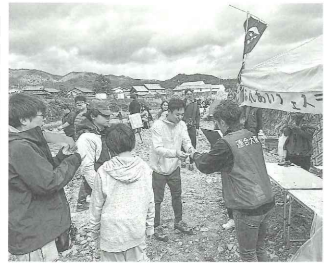
▲幼児も含めた家族など270人が参加したふれあいフェス

北大阪域内の勤労者とその家族の福祉の向上をめざし、休日のファミリーイベント「ふれあいフェス ティバル」(マス釣り大会とイモ掘り大会)が11月3日、摂津峡・芥川マス釣り場/谷口農園で行われた。 職場の仲間や幼児も含む家族連れなど270人が参加。北大阪労福協を構成する組織の地区・若手から選ばれた実行委員の協力で充実した休日をお過ごしください。