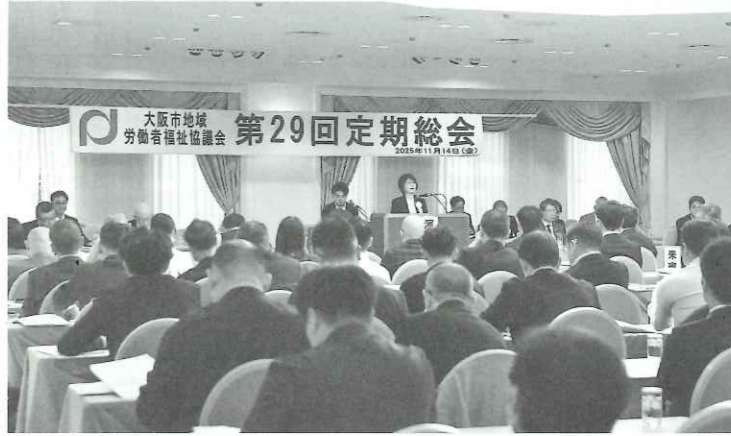
▲大阪市労福協の定期総会では若い世代や女性参画の事業計画などが承認