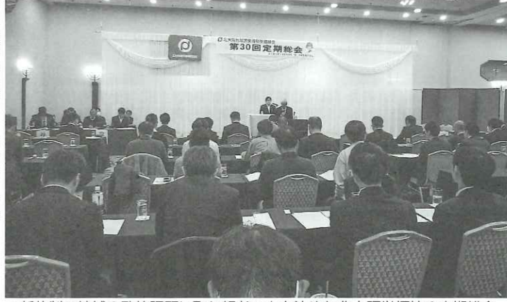
▲新体制で地域の政策課題に取り組むことを決めた北大阪労福協の定期総会