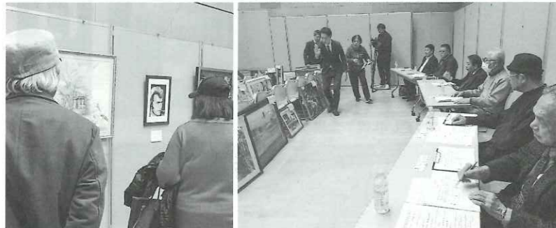
▲今年は194点の参加作品が展示された「なにわ美術展」。表彰式(上)には受賞者が参加。審査は点数評価により厳密に行われ(写真右下)、鑑賞者も真剣(写真左下)

今年で22回目となる「なにわ美術展」が11月18〜23日、エル・おおさか南館5階ホールで開催された。出品作品は194点という大規模で、出品者は96歳から15歳まで幅広く、作者を多岐とした。主催は一般社団法人・大阪労働者福祉協議会と一般財団法人・大阪労働協会。後援は大阪府、大阪市、堺市、近畿労働金庫大阪地区本部、こくみん共済coop大阪推進本部。展覧会の前日の17日に専門家や主催・共催団体などの代表者7人で入賞作品を決定する審査会が行われ、