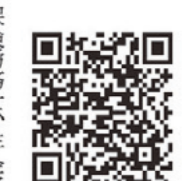
退職準備ゼミナール申し込みQRコード

点(百点満点)▽教皇採決(強行採決)▽ド重奮闘(孤軍奮闘)▽満員御英(満員御礼)▽応募多2(応募多数)▽奥国宝盛(五穀豊穡)が選ばれた。 「社会部長が選ぶ今年の10大ニュース」(新聞・新聞社主催)の1位は「高市早苗氏初の女性首相誕生、参院選で自公大敗受け」に決まった。在京新聞・通信8社の社会部長が選んだ。2位以下は次の通り。 ②クマ襲撃相次ぐ、被害過去最悪③コメなど物価高騰、政府備蓄米放出④戦後80年、記憶の継承課題に⑤大川原化工機冤罪(えんざい)、警視総監謝罪。川崎ストーカーでも大量処分⑥「ミスター」長嶋茂雄氏死去⑦ノベル賞に日本人2人、10年ぶりダブル受賞⑧埼玉東八潮市で道路陥没事故⑨名古屋26年前の殺人事件で容疑者逮捕⑩大阪・関西万博開催。