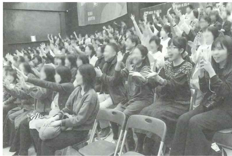
▲地元の大阪ブルテオン(男子バレー)を応援する参加者

この講演会を主催するのは大阪労福協。定員は150人(定員に達した場合はオンライン視聴のみ)となるが、事前の申し込みが必要。別項のQRコードまたは電話(06・6943・6025)で申し込みを。公演のテーマは、「人をやる気させる伝え方」スポーツ現場で学んだこと。