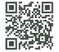
生活応援セミナーミドル世代編申し込みQRコード

生活応援セミナー「ミドル世代編」が大阪府協の主催で、4月18日の10～12時の予定で開かれる。会場はエル・おおさか（大阪市中央区北浜東3の14）本館7階708号室。オンラインでも10日まで受け付け可。定員は30人。 高齢の親を持つミドル世代の悩み、課題解決に向けて、働きながら支えるための生活支援と資産対策を講義する。内容は、▽介護保険の仕組みと利用例▽民間介護・福祉サービスの選び方▽自費サービスの利用方法と種類▽元気でうちにできる資産対策▽医療費による資産凍結・後見制度▽必要資金の予測と準備