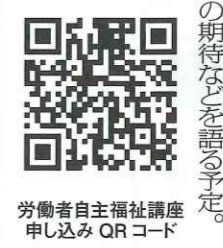
労働者自主福祉講座申し込みQRコード

「労働運動・労働者自主福祉運動・協同組合のこれから次世代を担う役員に寄せる期待」をテーマにした第11回労働者自主福祉講座が、5月15日午後6時